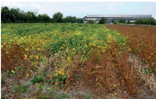
Сорта сои разных групп спелости, на исследовательском участке Венского Университета Природных Ресурсов и Наук о Жизни.

Система классификации ГС не является точной, но можно сказать, что сорта из ГС 000 в первую очередь предназначены для выращивания в основных районах производства сои в Европе к северу от Альп, а также в более прохладных регионах к югу и востоку от Альп. Более поздние сорта 00, обычно благополучно созревают в традиционно более теплых винодельческих районах и низменностях долин Рейна, Неккара, Майна и Дуная. Сорта с группой спелости – 0, созревают только в самых теплых районах к северу от Альп. Сорта из ГС 0000, являются самыми ранними и поэтому подходят для северных и приморских районов, где наблюдаются прохладные условия, или в качестве второй культуры в более теплых регионах. Из-за компромисса между раннеспелостью и накоплением биомассы, потенциальная урожайность сортов снижается от последних (X) до самых ранних сортов (0000). Современная селекция оказалась особенно эффективной в повышении потенциальной урожайности сортов, классифицируемых как ГС (000). На практике разница в урожайности между сортами 000 и 0000 является значительной, что может привести к тому, что фермеры предпочтут бобовые культуры холодного сезона в регионах с более прохладным климатом.