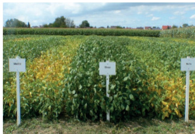
Различия между сортами в спелости, энергичности и устойчивости.

Miladinović, J., Hristić, M., Vidić, M. 2011. Soybean. Институт Полевых и Овощных Культур, Нови-Сад. стр. 278–281.