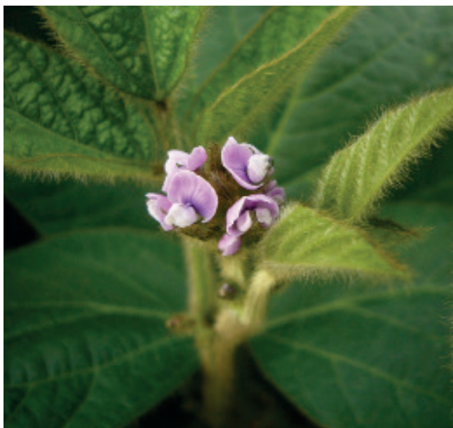
Цветок сои.

В зависимости от осенних погодных условий на участке, сбор урожая в сентябре обычно предпочтительнее, в то время как созревание сои в октябре сопряжено с погодными